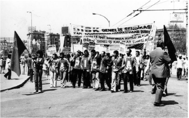
DİSK/Genel-İş Kapı Kalöriferciler Anadolu Yakası Şubesi, İstanbul